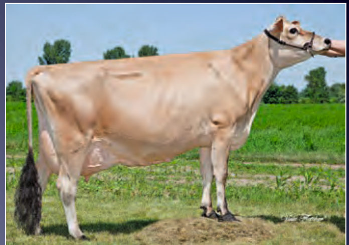
Rapid Bay Just Wait Dee Dee EX-92