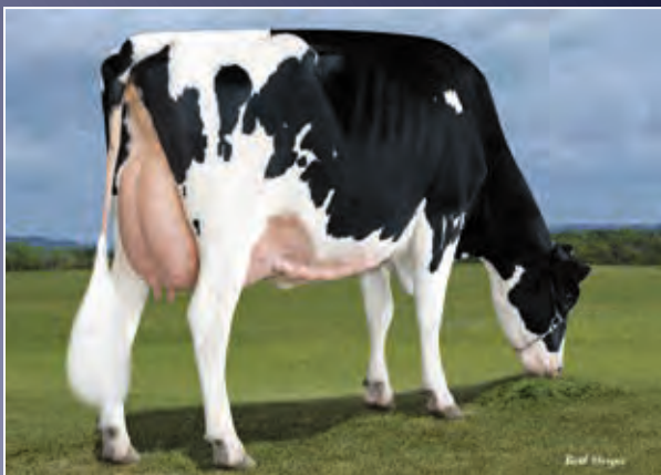
4. Mutter: Future-Jolane Uno Hay P VG-87