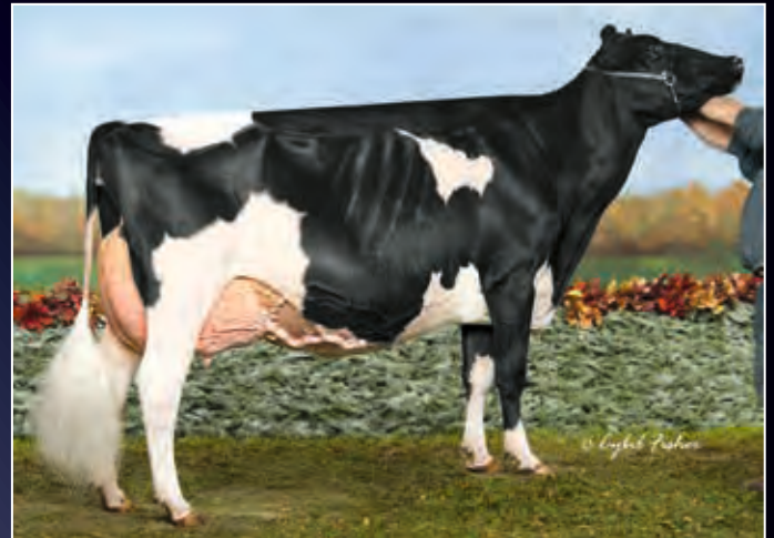
Weeksdale Judges Harmony EX-95

• 1st 5yr Old & Hon. Met. Grand Champion WDE 2016