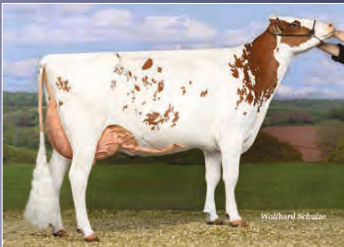
FG Natalie EX-92

Diese rotbunte Tochter der GDS Siegerkuh FG Natalie EX-92 kann auf ganzer Linie überzeugen. Die ersten Army-Töchter haben abgekalbt und zeigen phantastische Euter. Ihre Chance auf eine eigene FG Natalie!