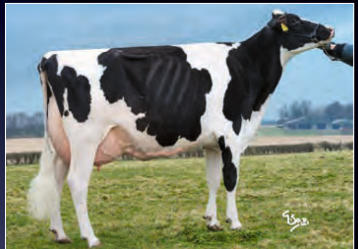
Vollschwester zur Oma: Golden Missy VG-86

• Grand Champion Royal Winter Fair &amp; World Dairy Expo 2011