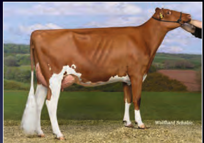
Vollschwester zum Verkaufstier: FG Cheyenne VG-85