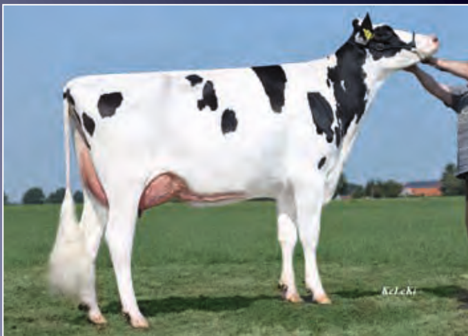
RR Rita 595 VG-87

Eine der ersten Gywer RDC-Töchter steht zum Verkauf. Sie kombiniert eine bewährte Kuhfamilie mit Exterieur und Leistung.