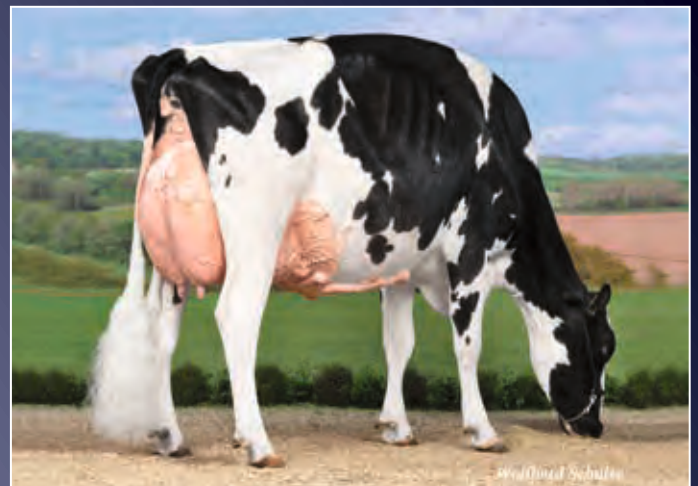
Fux Seattle EX-96