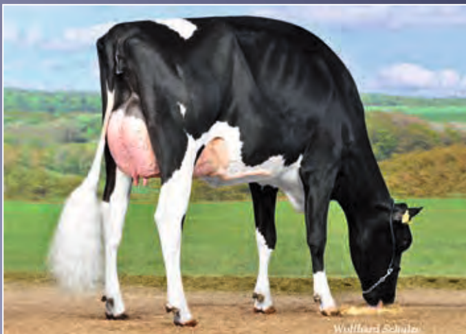
Garay Goldchip AI Right-ET VG-89

Diese Crown Red-Tochter vereint Stärke und Typ auf ideale Weise. Darüber hinaus stammt sie aus einer überragenden Kuhfamilie.