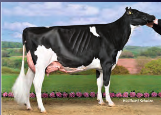
Fux Tohubawuhu EX-90

Ein weiterer Spross der Inspiration Tina-Familie kann sich hier in Szene setzen.