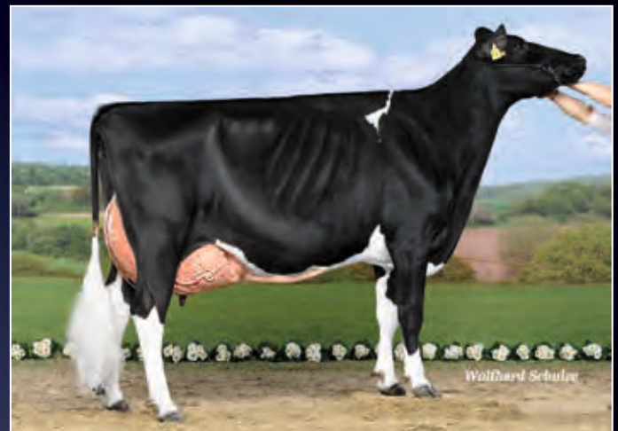
Aus der selben Kuhfamilie: Narnia EX-90