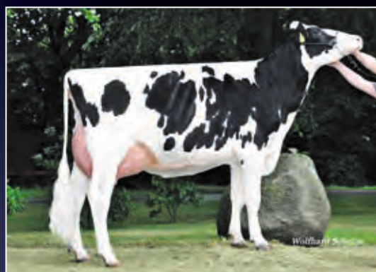
5. Mutter: MOK Belly VG-87