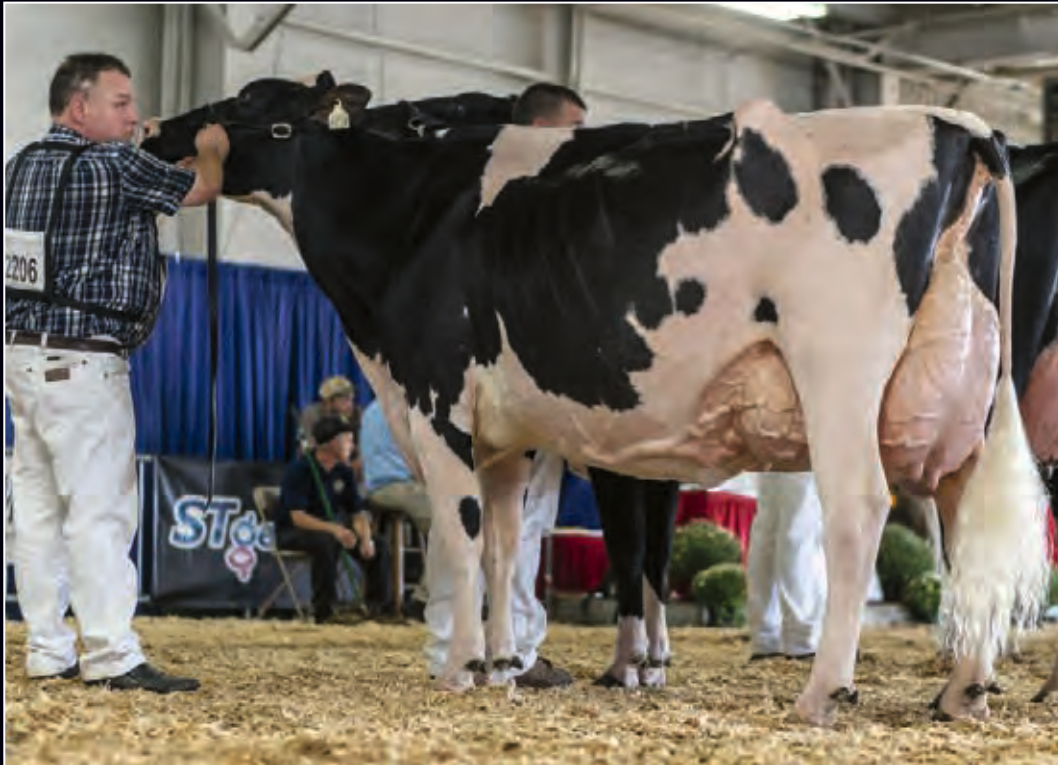
Pierstein Windbrook Alacazam EX-94