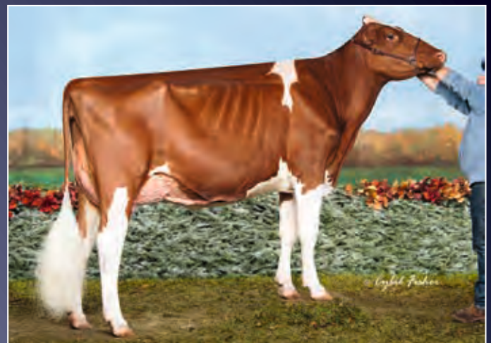
Pamprd-Acres Ab Ivy-Red-ET EX-94