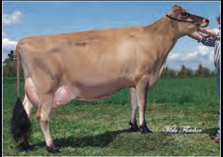
Piedmont Jade Doria EX-94