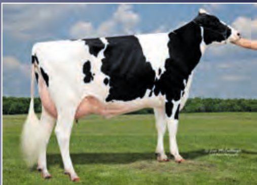
4. Mutter: Synergy Uno Pot O Gold-ET VG-88