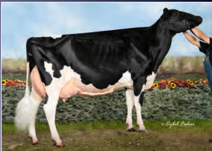
Eastside Lewisdale Gold Missy EX-95

Diese Kuh mit dem zweiten Kalb überzeugt mit Rahmen, Länge und einem phantastischen Euter. Sie wird Missy EX-95 alle Ehre machen.