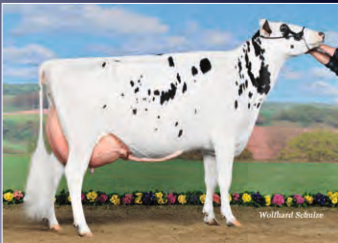
Chupin Shottle Faith EX-91

Hier zeigt die Rolls-Familie erneut wofür sie steht: Exterieur und Leistung in perfekter Kombination!