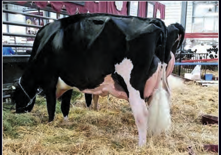
Arolene Goldwyn Divine EX-95