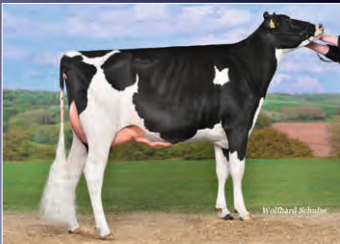
Aus der selben Familie: FLO Idee VG-86

Eine schwarze Diamondback-Tochter wie sie im Buche steht! Und das aus drei Generationen exzellent bewerteten Kühen.