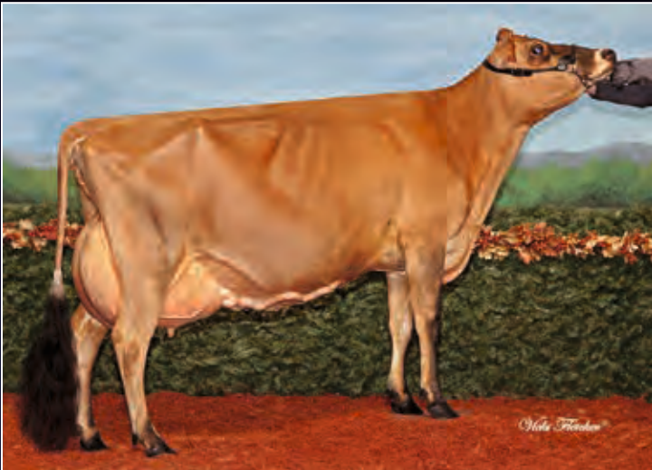
Schwester zur 2. Mutter: Rapid Bay Connection Dorelle EX-94