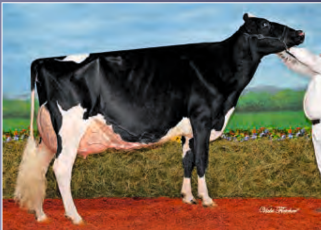
MS Goldwyn Alana EX-96

Diese Mirand-Tochter entstammt einer der erfolgreichsten Kuhfamilien Nordamerikas der letzten 20 Jahre. Sie ist ein sicherer Garant für Exterieur.