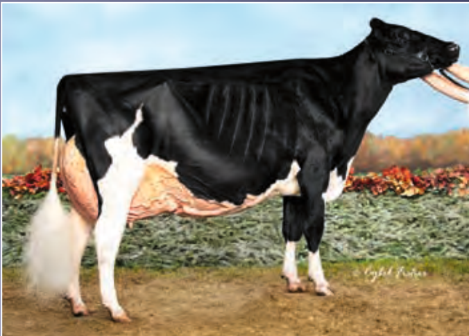
Rosiers Blexy Goldwyn EX-97

Blexy etabliert sich als Zuchtkuh. Hier haben Sie die Chance ihre Summerfest-Enkelin zu kaufen. Eine Empfehlung für die nächsten Typtierwettbewerbe.