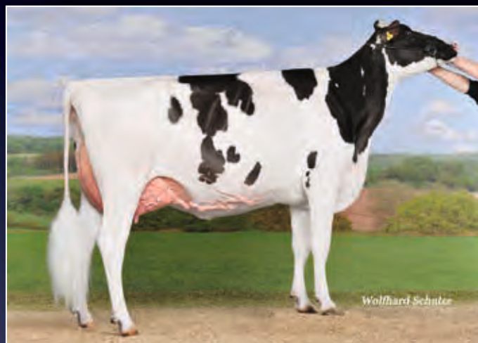
Schwester zur Mutter: Castel Sid Toxie EX-91