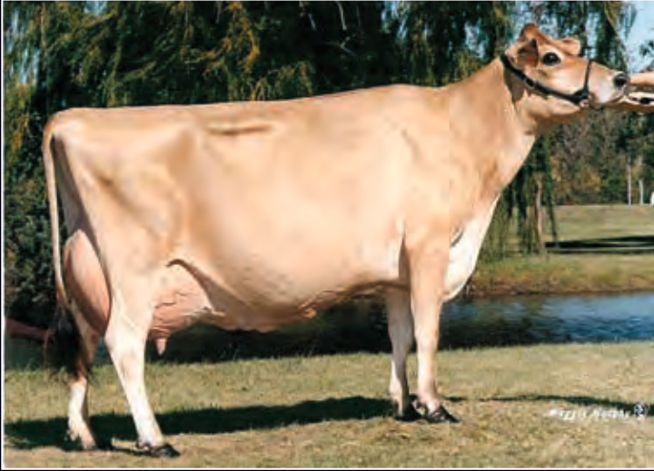
5. Mutter: Ron-Net Maple Dorie Dee EX-95