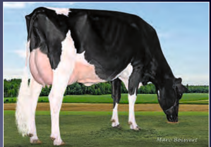
VT-Pond-View Gold Allure-ET EX-91