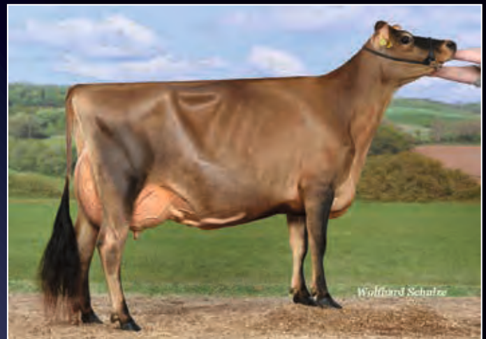
Schwester zum Verkaufstier: Elsa EX-90

• Sieger Alt Jersey German Dairy online Show