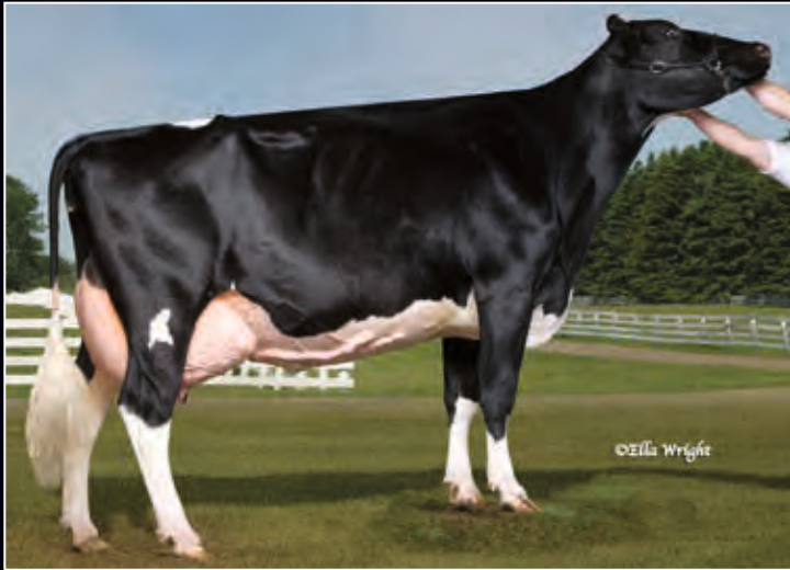
Wendon Triumph Divine EX-94