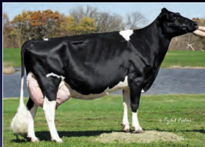
4. Mutter: Ernest-Anthony Tyra EX-94