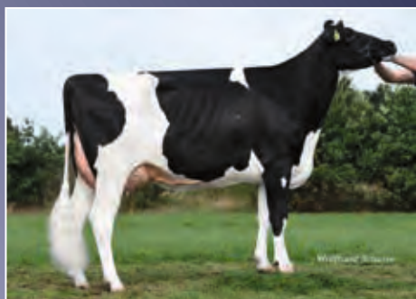
ZB Miriam VG-87