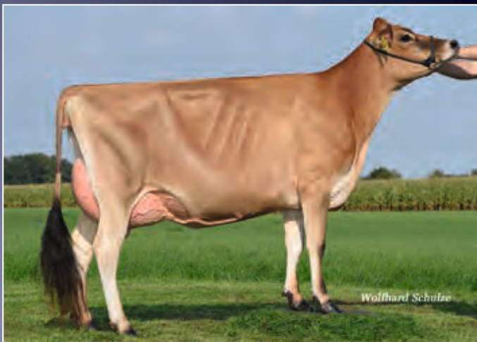
Aus derselben Kuhfamilie: Barbie VG-86

Typstarke Tequila-Tochter, die mit viel Exterieur und guter Leistung überzeugt.