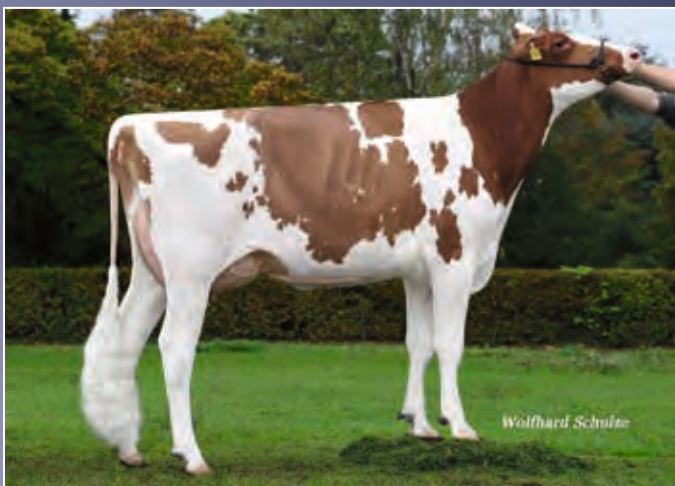
Golden Oaks Jordy Ivanka-Red VG-87

Pamprd-Acres Ab Ivy-Red-ET EX-94 stellt erneut erfolgreich ihre Leistung als Zuchtkuh unter Beweis. Ihre rotbunte Mirand-Enkeltochter ist der perfekte Einstieg in diese Kuhfamilie.