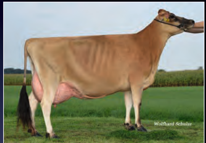
Schwester zur Mutter: WIT Bavaria EX-90