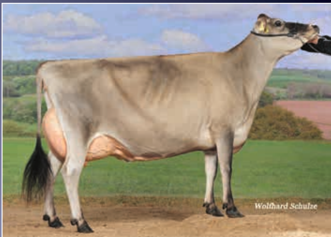
Elfi 70 EX-90

Eine abgekalbte Jersey-Färse aus dem Herzen der Evita EX-91-Familie. Hier ist Typ und Leistung in idealer Weise kombiniert.