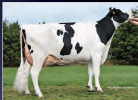
4. Mutter: Supersire Mata VG-88