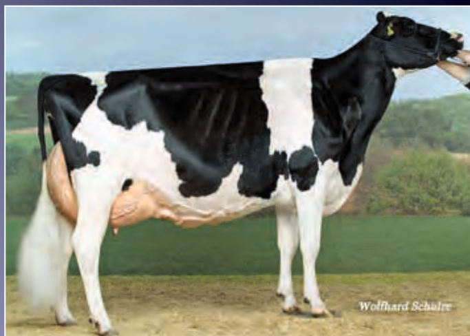
Castel James Jolie EX-95

Abgekalbte Unix-Tochter aus exterieurstarker Familie. Ihre Gelegenheit, eine fertige Jolie zu kaufen.