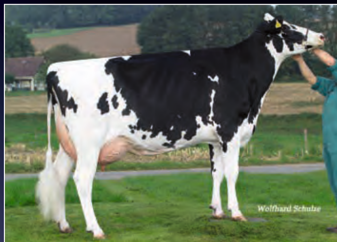
6. Mutter: Petra EX-90