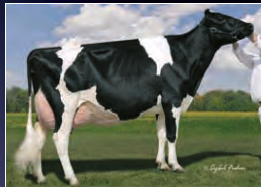
7. Mutter: Lylehaven Lila Z EX-94