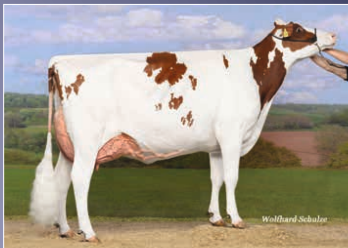
Schwester zum Verkaufstier: Mabella VG-88

Birkenhof Rubens Mabel EX-93 beweist erneut ihre Qualitäten als Zuchtkuh. Mit HAD Marie Red kommt ein auffällig korrekter und harmonischer Spross dieser Familie zum Verkauf.