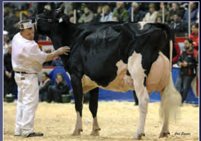
MS Goldwyn Alana EX-96