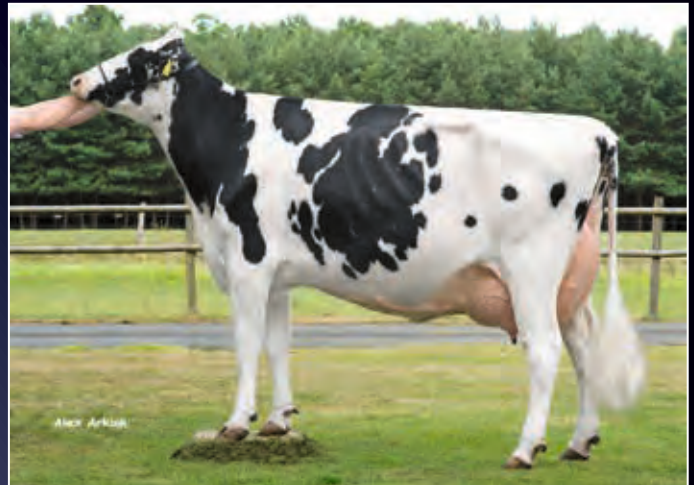
Loh Nightgirl EX-92