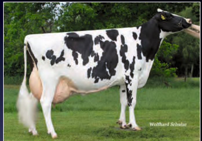
FLO Ita EX-90