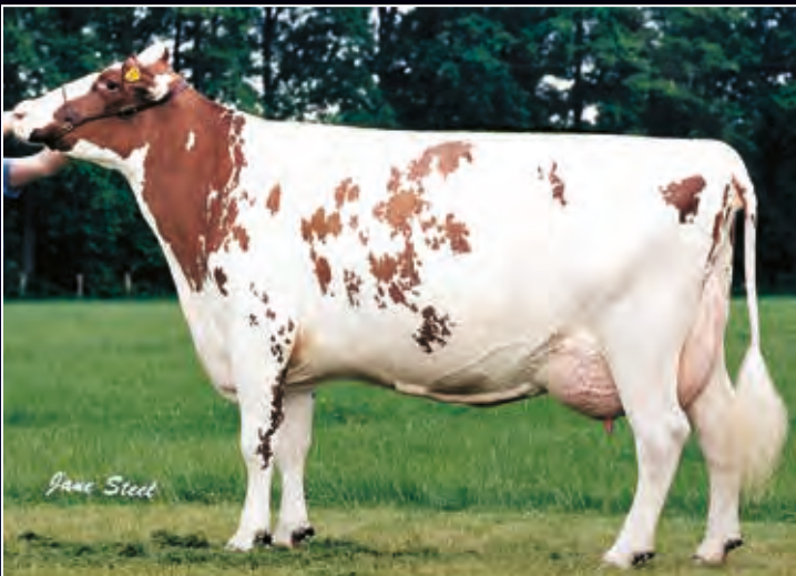
6. Mutter: FG Natalie EX-93