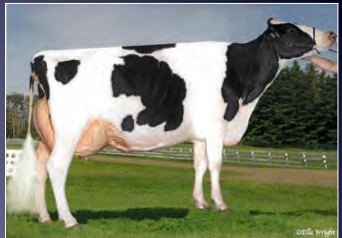
Wendon Dundee Divina EX-92