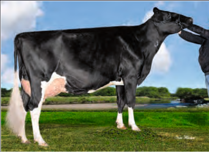
Schwester zur Mutter: Garay Goldchip Allanis EX-90