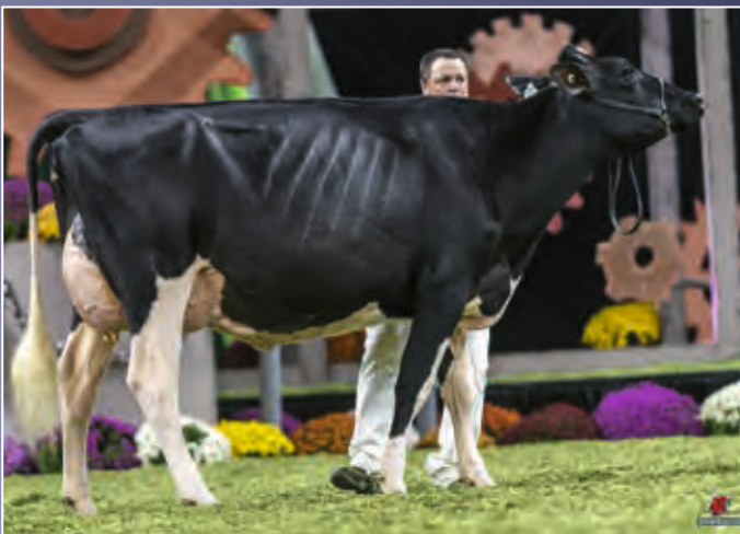
Sidbeauty Dmpsy Brittany-ET EX-92

Was für ein Pedigree, hier geben sich die Schausieger Nordamerikas die Ehre! Auch die ersten abgekalbten Töchter von Denver können mit Schauerfolgen brillieren. Ein Pedigree zum Träumen.