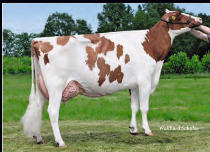
Schwester zur 2. Mutter: WILc Magic VG-88