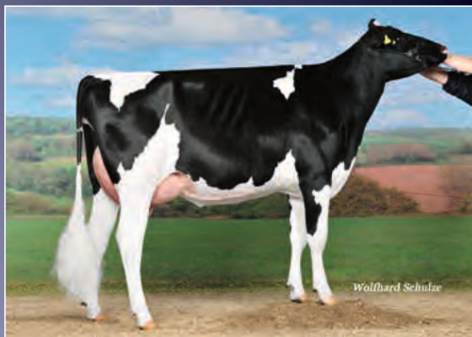
4. Mutter: Peggy VG-87

Sie suchen rotbunt und hornlos?! Hier kommt Ihre Chance!