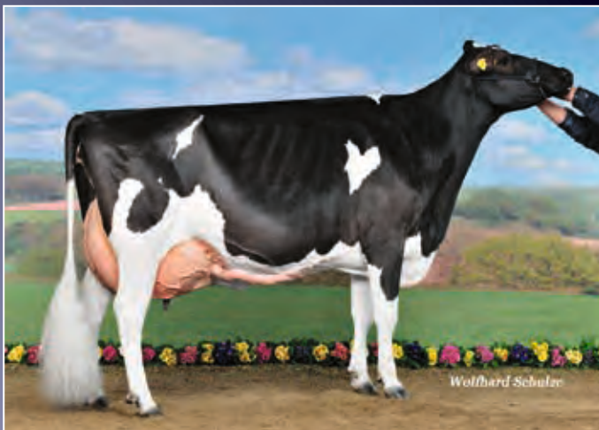
Aus der selben Kuhfamilie: Nizza EX-94

Hier stellt Atwood wieder seine Fähigkeiten unter Beweis. Er kann sie machen, die besonderen Kühe - und Nikita weiß zu gefallen!