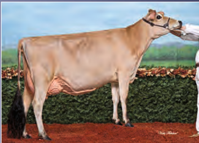
Rapid Bay Gentry Dina Deja EX-91

Was für eine Gelegenheit! Joyride aus einer der hoffnungsvollsten und zeitgleich erfolgreichsten Jerseykühen in Kanada.