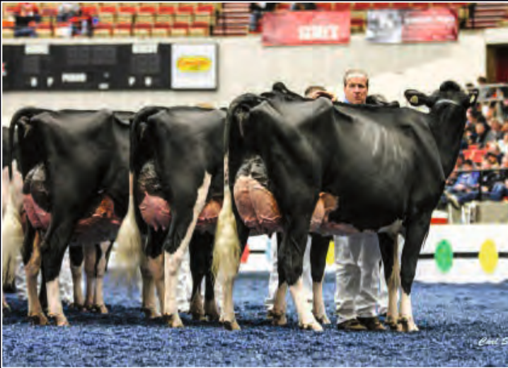
Jacobs Sid Beauty EX-95