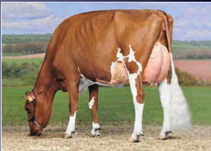
FG California VG-89

Rotbunt! Eine Dice Red-Tochter aus der Bundesschau Siegerkuh FG California VG-89. Diese junge Dame ist bereit, in die Fußstapfen ihrer Mutter zu treten!