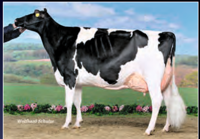
Schwester zur Mutter: Shakira EX-93