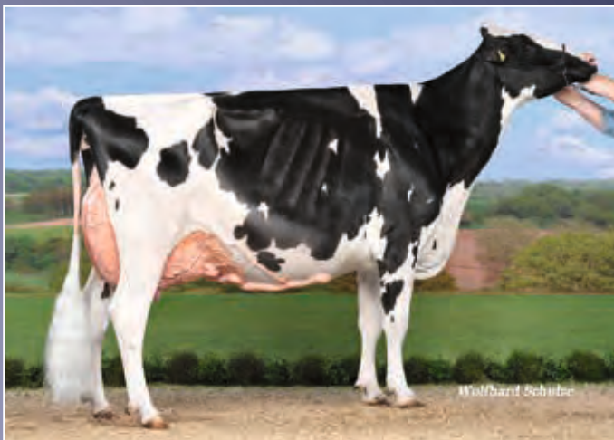
Fux Seattle EX-96

Die erste Chance eine direkte Tochter aus einer der erfolgreichsten Schaukühe Deutschlands zu kaufen: Fux Seattle EX-96!