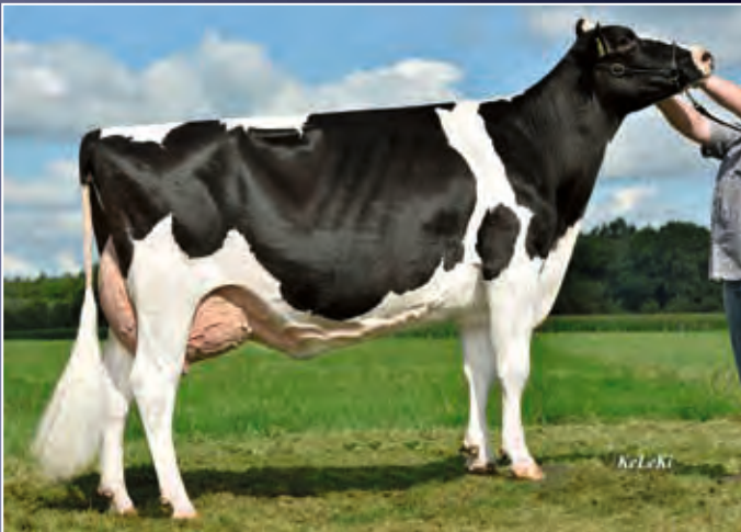
Loh Natiogirl EX-94

Diese ausbalancierte, kapitale Färse entstammt einer der bekanntesten deutschen Kuhfamilien. Sichern Sie sich Ihren Zweig der Nation-Familie.