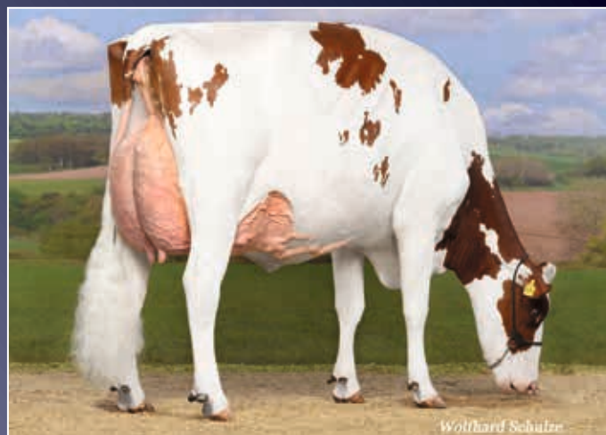
Schwester zum Verkaufstier: Mabella VG-88