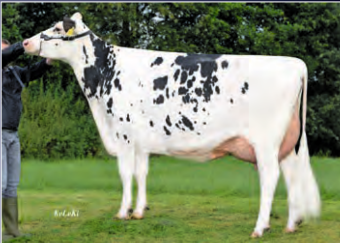
4. Mutter: Extase VG-85

Die Familie von Pioneer Extase VG-87 ist ein sicherer Garant für hohe Zahlen und funktionierende Kühe.