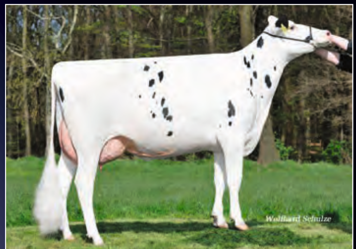
4. Mutter: Nena VG-86