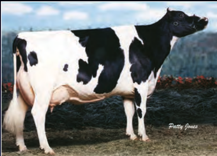
6. Mutter: Rainyridge Tony Beauty EX-94