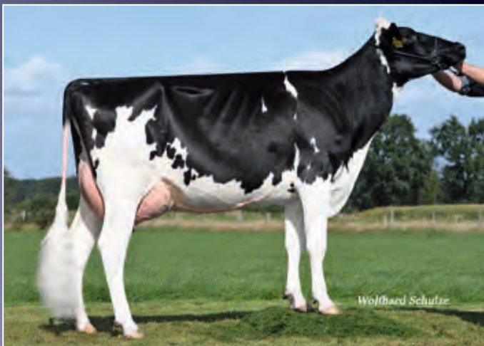
Schwester zur Mutter: Kenya VG-86

Erneut zeigt unsere Europaschau-Siegerkuh Outside Kora EX-94, dass sie auch hervorragend züchtet. Diese junge Redrock-Tochter begeistert mit einem grandiosen Euter.