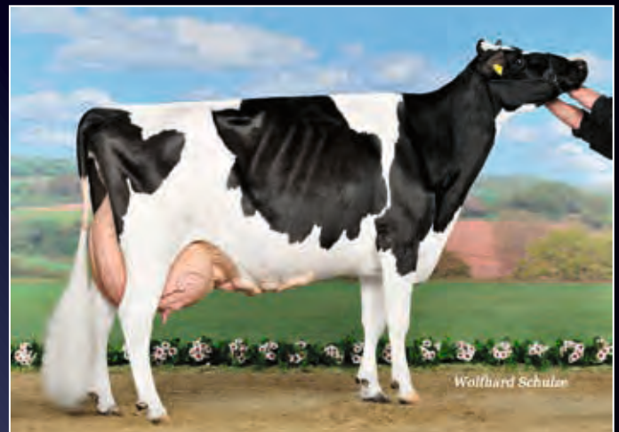
5. Mutter: Outside Kora EX-94