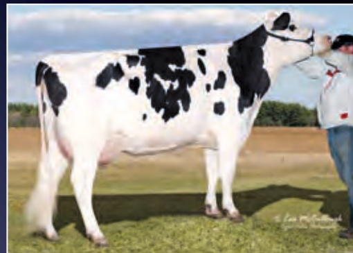
7. Mutter: Glo-Crest O Man Pirate 4092 EX-90