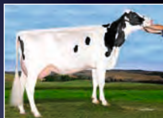
4. Mutter: EDG Lacy Shotglass 748-ET VG-85