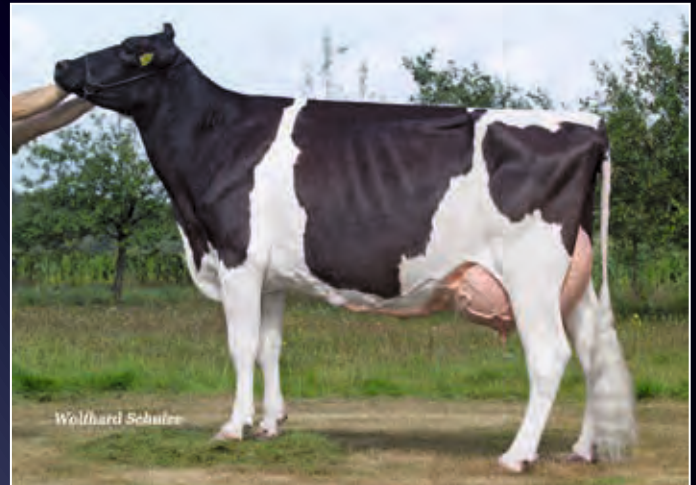
My Lady VG-86