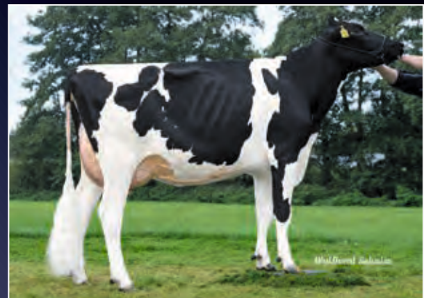
HMO MAR Hula VG-86