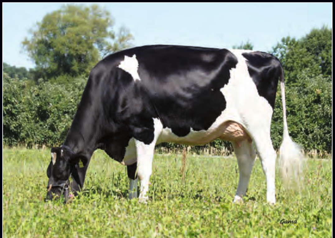
Blondin Doorman Alana VG-86