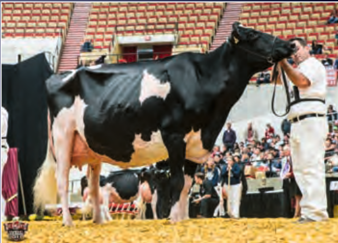
Weeksdale Judges Harmony EX-95

Typstark, großrahmig und eine auffällige Zeichnung, so ist diese abgekalbte Solomon-Tochter zu beschreiben.