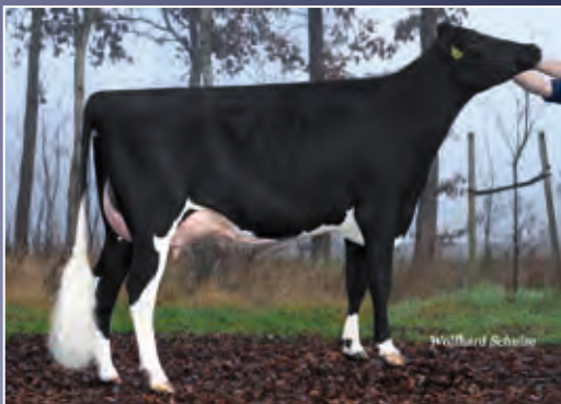
WKM Ladyliz Mr GP-83