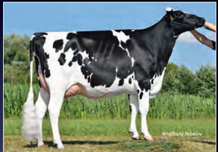
Schwester zur Mutter: Francine VG-89