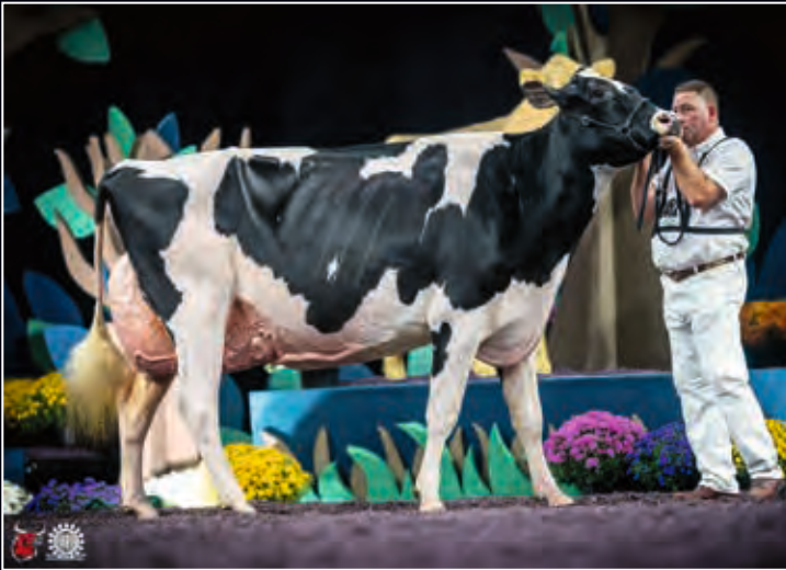
MS Sid Blexy VG-89