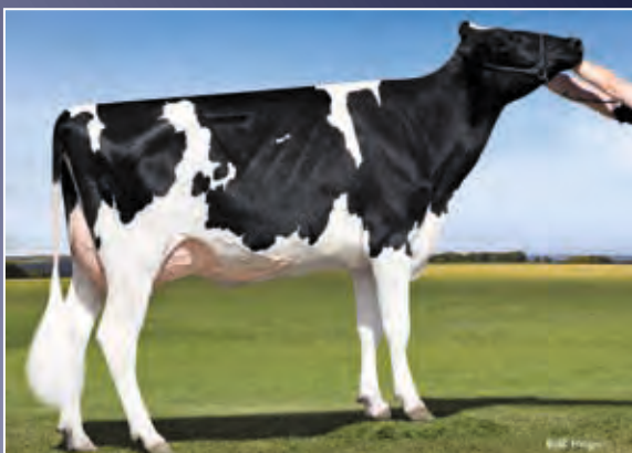
4. Mutter: View-Home McC Alabama GP-82