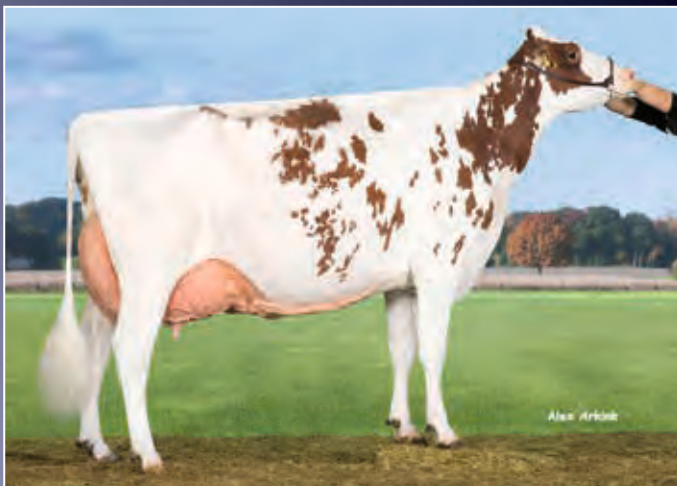
WR Brandy EX-92

Rotbunte Apple Crisp-Tochter aus schauerfahrener Kuhfamilie. Die perfekte Kombination aus Leistung und Exterieur.