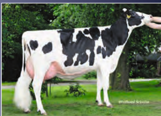
4. Mutter: MOK Fanatic Baby VG-85