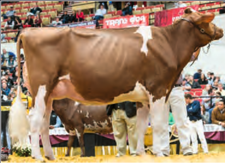
Pamprd-Acres Ab Ivy-Red-ET EX-94