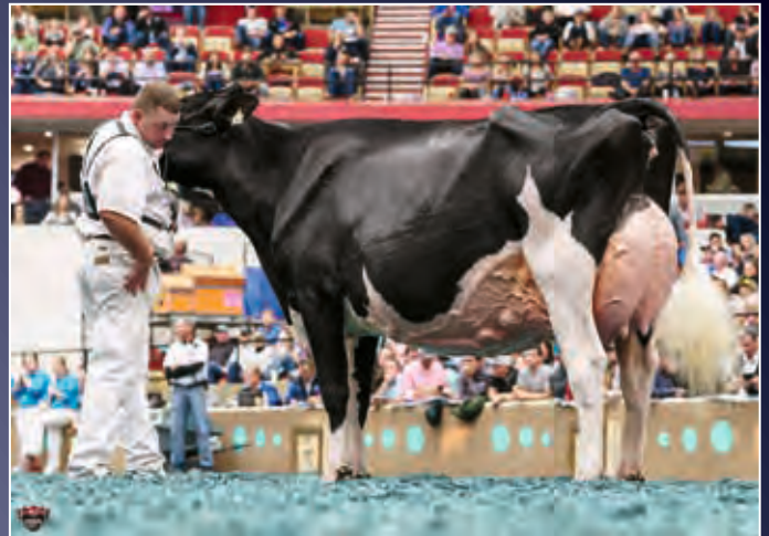
Rosiers Blexy Goldwyn EX-97