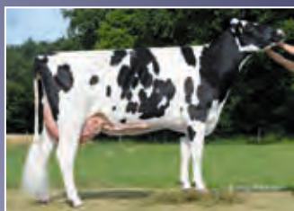
WSH Laola VG-85