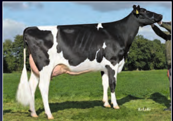
RR Rita 215 VG-87