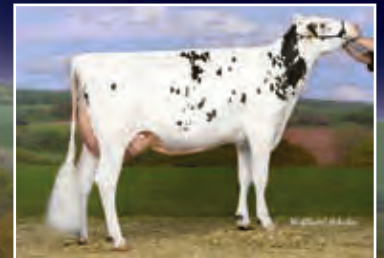
Tochter Xenia VG-86