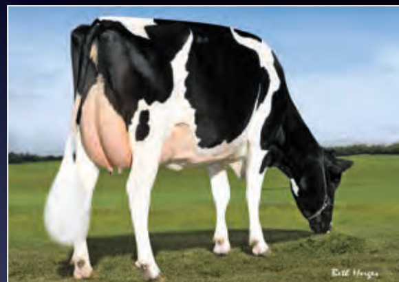
5. Mutter: Pine-Tree 2149 Robst 4846 VG-87