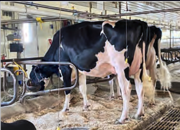
Blexys Doorman Brandy VG-87