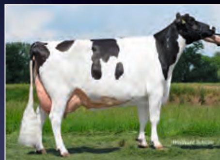
RDG Nely EX-91